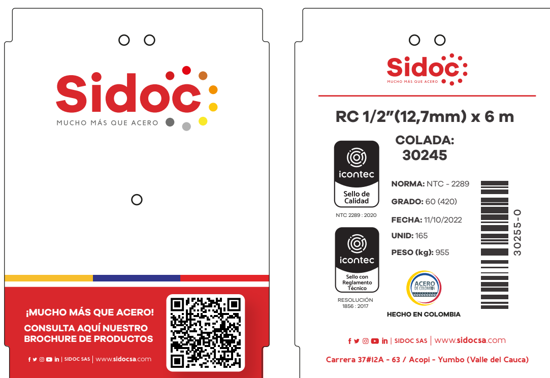
Figura 1. Etiqueta de identificación producto terminado.

La etiqueta de identificación debe ser legible, veraz y completa, a su vez se colocará en un lugar visible, de fácil acceso y disponible al momento de la comercialización.