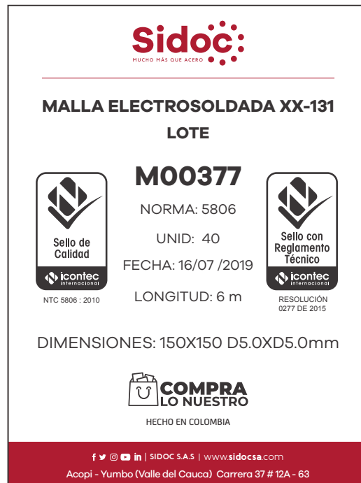
Figura 2. Etiqueta de identificación producto mallas.

La etiqueta de identificación debe ser legible, veraz y completa, a su vez se colocará en un lugar visible, de fácil acceso y disponible al momento de la comercialización.