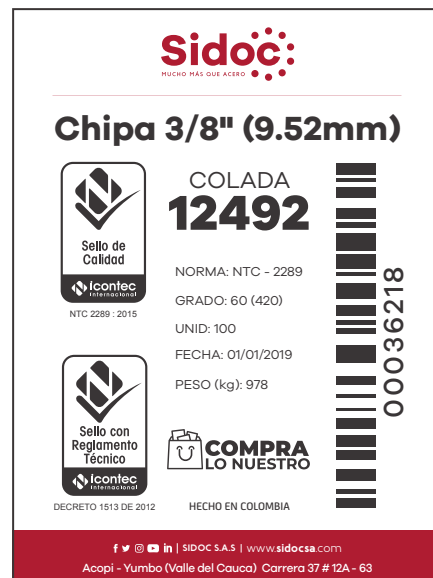
Figura 1. Etiqueta de identificación producto terminado.

La etiqueta de identificación debe ser legible, veraz y completa, a su vez se colocará en un lugar visible, de fácil acceso y disponible al momento de la comercialización.